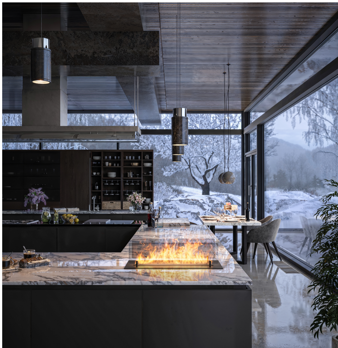
Biokominek Insert Black 600 (LONGFIRE)